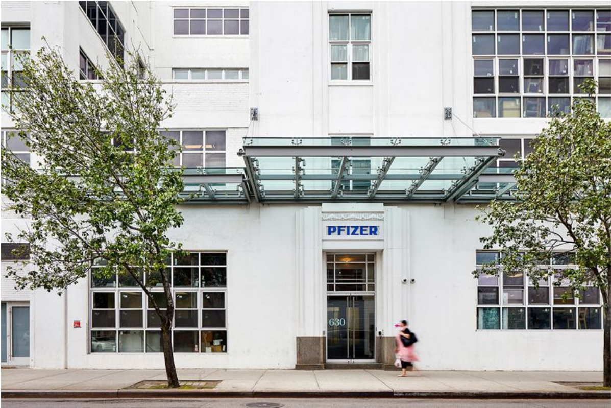
THE IW GALLERY：紐約布魯克林法拉盛大道 630 號